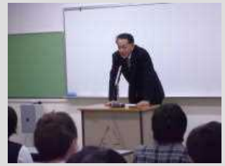
進路指導部長より