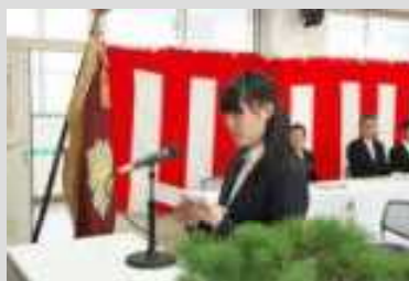
新入生誓いの言葉