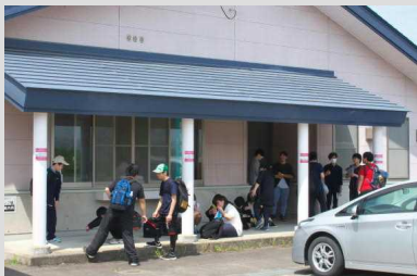
せせらぎ公園で休憩