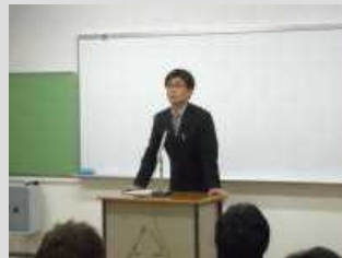
生徒指導部長より